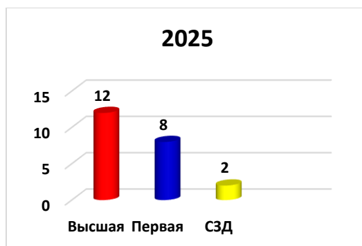
Диаграмма с характеристиками кадрового состава детского сада